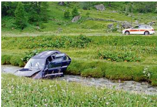
Nach einer Streifkollision kommt das Fahrzeug von der Strasse ab.

LA RÖSA Gründlich misslungen ist das Überholmanöver einer 23-jährigen Autofahrerin gestern Vormittag im Puschlav: Die Junglenkerin streifte einen entgegenkommenden Traktor, kam von der Strasse ab und landete im Bach Poschiavino. Wie die Kantonspolizei mitteilte, war die Frau in Richtung Tirano unterwegs und begann vor einer Rechtskurve zu überholen. Der Traktor konnte laut Polizeiangaben gerade noch ausweichen, sodass es nur zu einer leichten Streifkollision kam. Trotz harter Landung im Bergbach wurde die Lenkerin nicht verletzt. Das Auto musste von der Feuerwehr Poschiavino geborgen werden. (SDA)